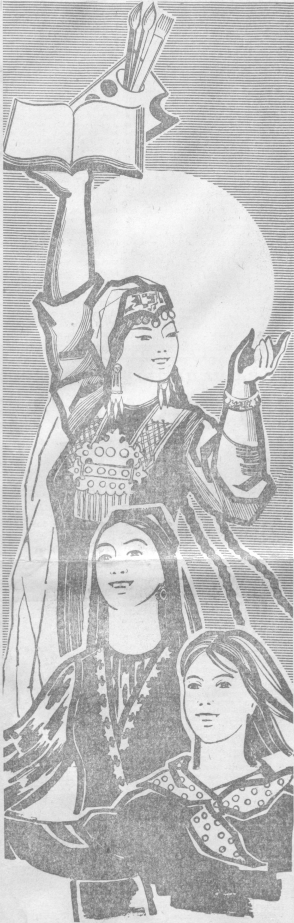
Рис. З. ЛЕЛЯВСКОЙ.