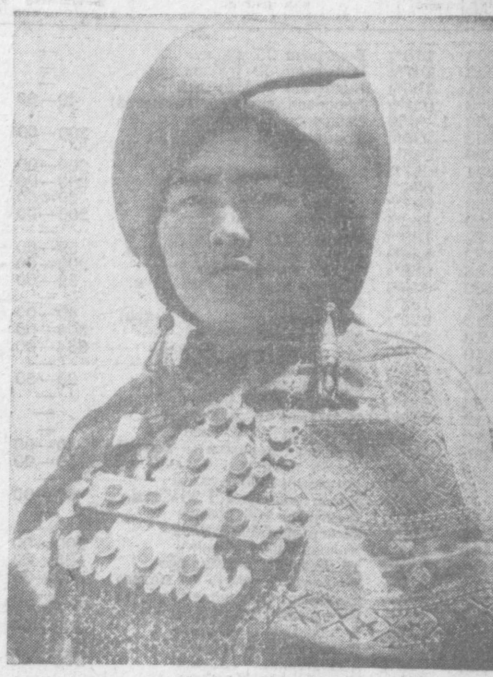
Каракалпачка в национальном уборе.