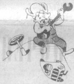
Горько-механизатор: «Обидно, пока растает снег».

Хозяйства области не вывели на линейку готовности около 2.000 тракторов. Особенно неприглядная картина в Бекабадском и Янгйулганском районах, где еще не тронут тракторный парк. Ждут не дожидаясь своей очереди тракторные сеялки: из 2.475 отремонтированных