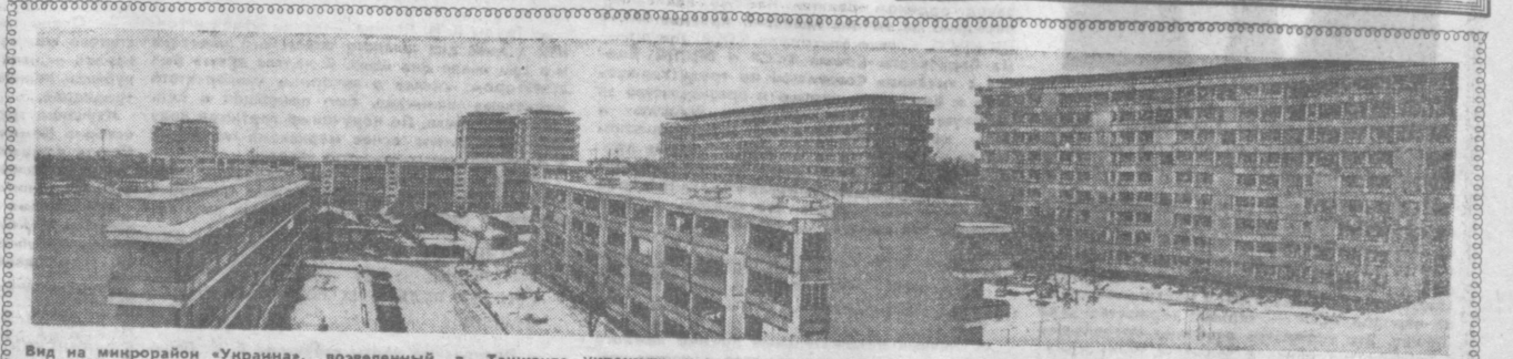
Вид на микрорайон «Украина», возведенный в Ташкенте украинскими строителями.

ДЕТИ — наше будущее. Им мы уделяем озорное внимание, о них наша забота. Тем радостнее, что украинские строители подарил маленьким ташкентцам чудесный детский комбинат на 280 мест. Светлые спальни, уютные комнаты, во дворе оборудованы фонтаны и площадка для игр. Киевский строительный-монтажный поезд № 3 снабдил нас мебелью. Недавно мы торжественно отметили годовщину новоселов. От имени воспитателей, воспитанников и родителей выражаем сердечную признательность и благодарность посланцам братской Украины за замечательный подарок. Д. КАЙДИНОВА. Заведующая детским комбинатом № 389 Ленинского района.