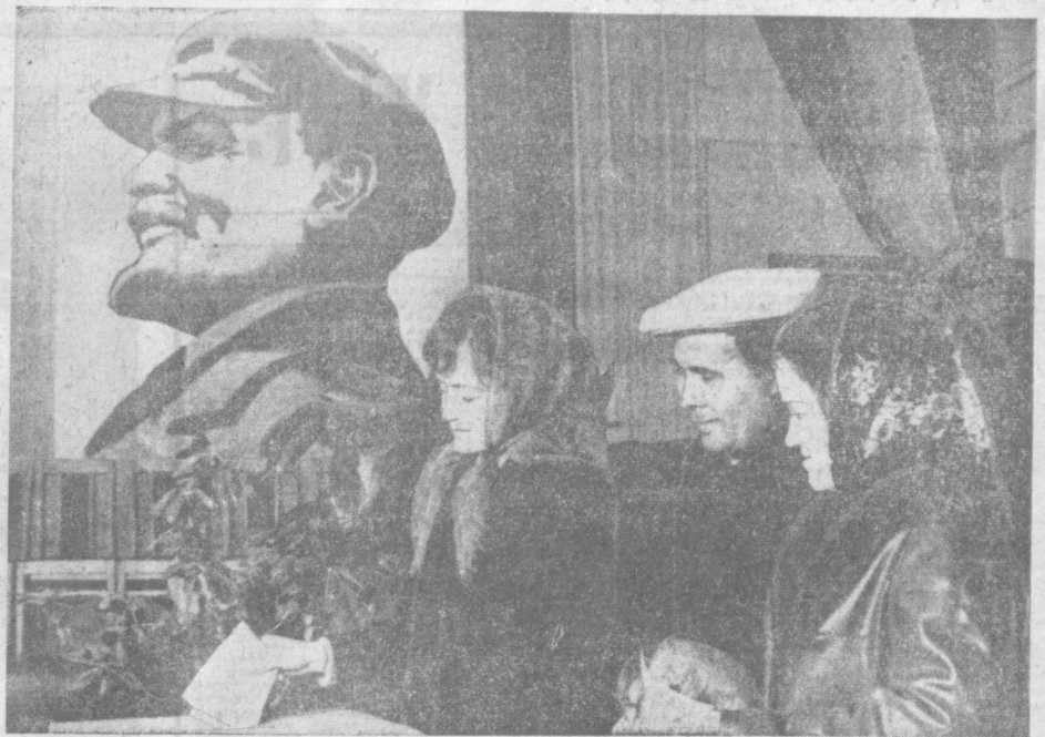
16 марта на избирательном участке № 69 Октябрьского района г. Ташкента.

(Передовая статья «ПРАВДА» за 17 марта).