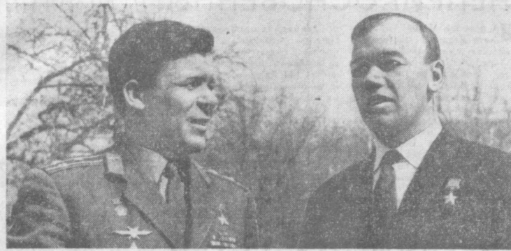
Летчики-космонавты, Герои Советского Союза Е. В. Хрунов и А. С. Елисеев.

ЕВГЕНИЙ Хрунов и Алексей Елисеев в Ташкенте.