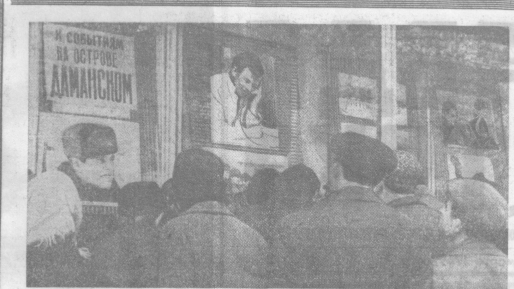
В Ташкенте на улице Карла Маркса установлена витрина с фотографиями корреспондентов газеты «Известия», рассказывающих о событиях на острове Даманский.

Выполняя заветы В. И. Ленина, Коммунистическая партия и Советское правительство неустанно заботятся о повышении жизненного уровня населения, уделяют особое внимание укреплению здоровья трудящихся, организации их санаторно-курортного лечения и отды-