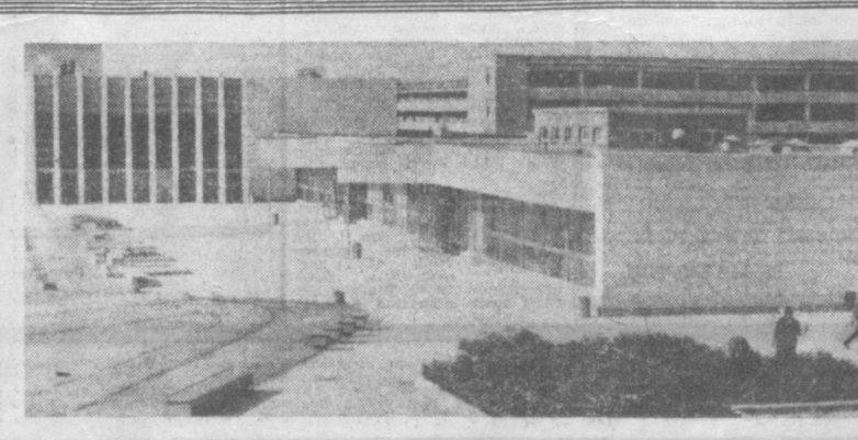
Торговый центр в молодом городе золотодобытчиков — Зарафиане.