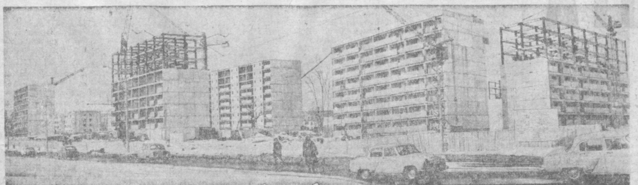
Хорошую память оставит о себе в Ташкенте строители Российской Федерации, пришедшие на помощь пострадавшему городу. Они воздвигнут много хороших жилых домов, школы, магазины и другие объекты. На улице Навои они возводят несколько многоэтажных жилых домов. Панораму многого строительства вы видите на нашей снимке.