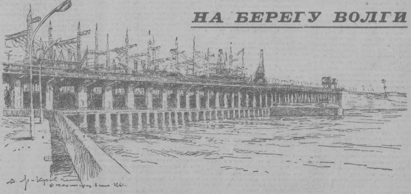
Волжская гидроэлектростанция имени XXII съезда КПСС. Рисунок специального корреспондента «Правды» заслуженного деятеля искусства Литовской ССР А. Я. Нравченко.