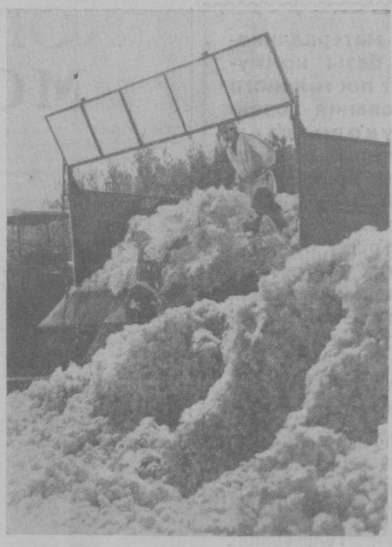
Колхоз имени Сталина Джизакского района в этом году широко практикует бестарную перевозку хлопка. Использование восьми тракторных тележек позволило высвободить много хирманчиков, сэкономить деньги на таре и дополнительно снизить себестоимость сырья...