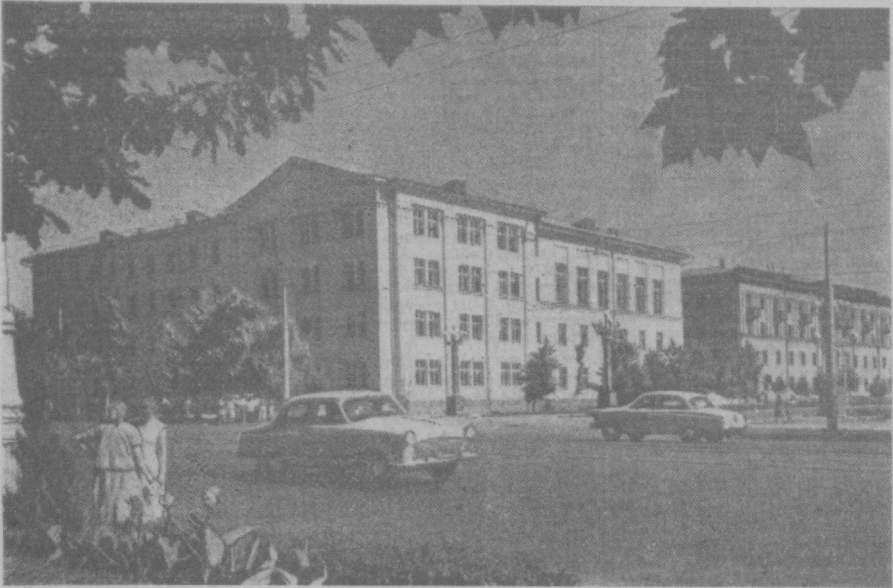
ТАШКЕНТ СЕГОДНЯ. Вид на перекресток улиц Навои и Пахтакорской.