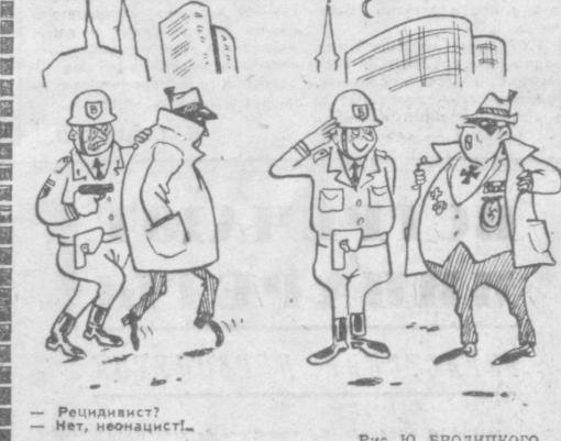
Рис. Ю. БРОДИЧКОГО.

В. ЗЮГАНОВ. Международный обозреватель «Правды Востока».