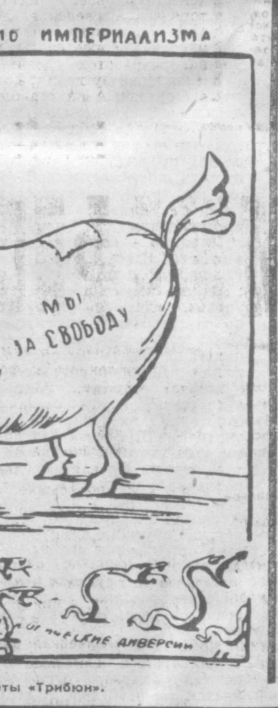
Карикатура из цейлонской газеты «Трибюн».