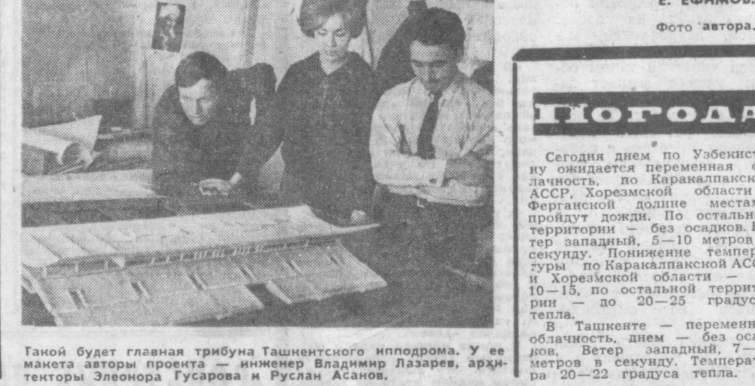
Такой будет главная трибуна Ташкентского ипподрома. У ее макета автор проекта — инженер Владимир Лазарев, архитекторы Элеонора Гусарова и Руслан Асанов.

Тысячи людей потянутся на эти арены, в аллеи парка, к пляжам озера. Что ж, сюда будет удобно добираться: рядом кольцевая дорога и проспект Дружбы народов, стоянка на сотни автомашин, станция будущего метро. Итак, первый сезон на аренах всех скоростей — в начале семидесятых годов. Е. ЕФИМОВ.