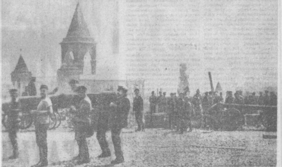
В. И. Ленин на Всероссийском субботнике работает на переноске дров во дворе Кремля 1 мая 1920 года.