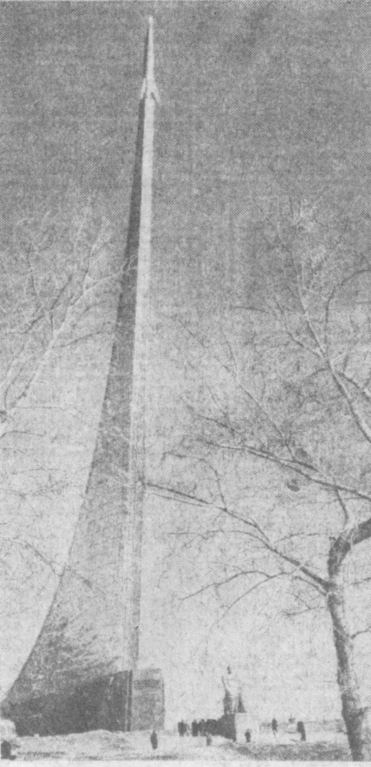
На снимках: слева — обелиск в честь покорителей космоса на проспекте Мира в Москве. Справа — летчик-космонавт СССР, Герой Советского Союза (в первом ряду слева направо): А. Г. Николаев, П. И. Белая, В. В. Николаев-Терешкина, В. Ф. Быковский, П. Р. Попович, Г. С. Титов (во втором ряду): К. П. Феонистов, В. В. Волынов, Е. В. Хрунов, Г. Т. Береговой, В. А. Шаталов, А. С. Елисеев, А. А. Леонов и Б. Б. Егоров.

БЕСЕДА С ЛЕТЧИКОМ-КОСМОНАВТОМ СССР Г. Т. БЕРЕГОВЫМ