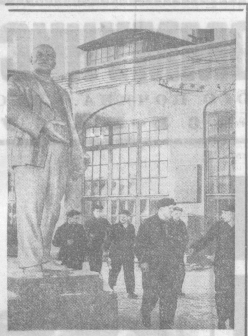
На этом месте в 1919 году в депо Москва-Сортировочная Московских железных дорог был проведен первый коммунистический субботник, о котором писал В. И. Ленин в статье «Великий почин».

В музее — выставка из постановки общего собрания роликотного цеха от 13 октября 1958 года. На этом собрании были приняты первые коммунистические обязательства. Двум локомотивным брига-