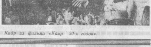
Кадр из фильма «Каир 30-х годов».

В основе нового художественного фильма «КАИР 30-х годов» факультета. Вместе посетили они лекции, рядом жили в студенческом общежитии. Но трудовая жизнь началась у них по-разному. Фильм, поставленный кинематографистами ОАР при содействии организации «Спасение культуры», рассказывает о жизни и деятельности студентов в Египте в 30-е годы и указывает на корни египетской революции. Авторы сценария — Ариф Аз Заррани, Вафия Хайри и режиссер — Салах Абу Сейф.