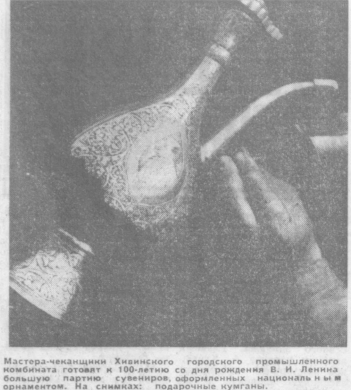
Мастера-чланыцины Хивинского городского провильшенного комбината готовят и 100-летню со дня рождения В. И. Ленина большую партию сувениров, офороненных национальнми орнаментом. На снимках: подарочные кумганн.

ХОТЯ И ДАЛЕКО ОТ ГОРОДА ГЕОЛОГИ, как правило, работают в отдаленных местах. Но это не мешает разведчикам недр жить интересно, содержательно.