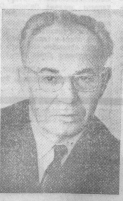
Первый секретарь Центрального Комитета Коммунистической партии Чехословакии тов. Густав Гусак.

ПРАГА, 18 апреля. (ТАСС). Агентство ЧТК передало следующее коммюнике о пленуме ЦК КПЧ: