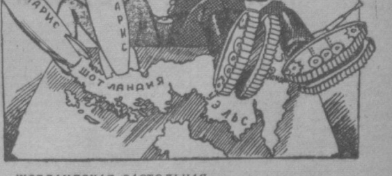
ШОТЛАНДСКАЯ ЗАСТОЛЬНАЯ... Рис. А. Грунина.