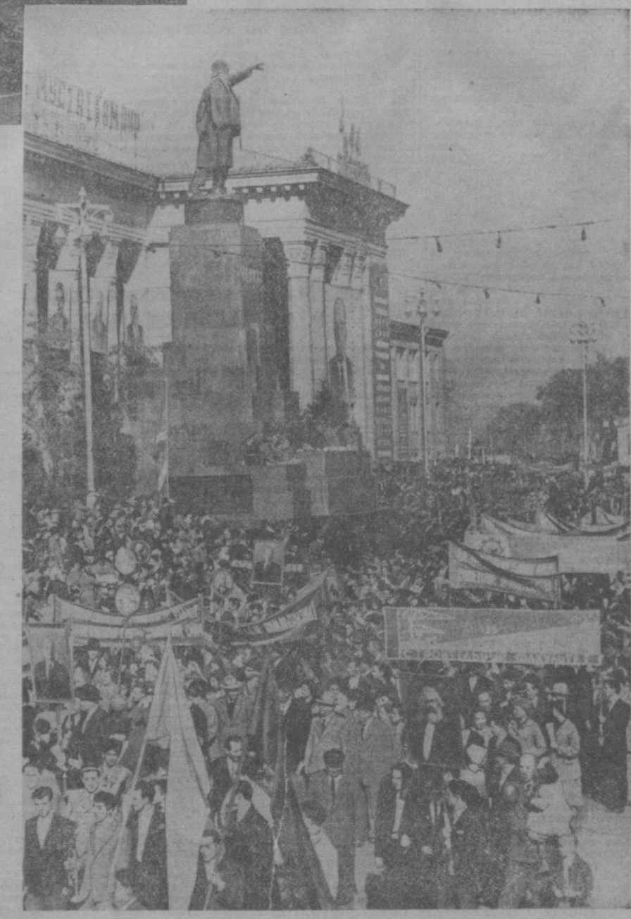
ТАШКЕНТ, 7 НОЯБРЯ 1961 ГОДА. Демонстрация трудящихся на площади имени В. И. Ленина.