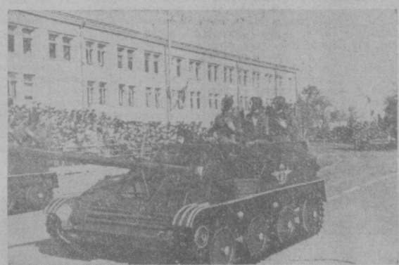
ТАШКЕНТ, 7 НОЯБРЯ 1961 ГОДА. Парад войск гарнизона на площади имени В. И. Ленина.

«Все во имя человека, все для блага человека» — этот девиз партии нашел конкретное воплощение