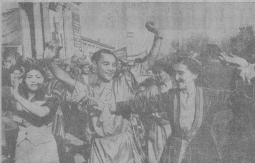
ТАШКЕНТ, 7 НОЯБРЯ 1961 ГОДА. Демонстрация трудящихся на площади имени В. И. Ленина.