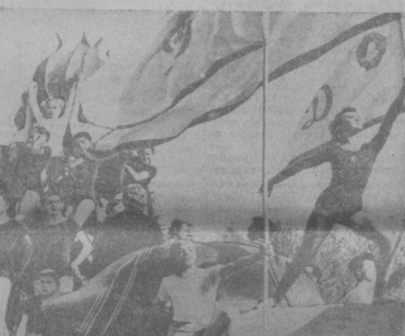
ТАШКЕНТ, 7 НОЯБРЯ 1961 ГОДА. Спортсмены на площади имени В. И. Ленина.