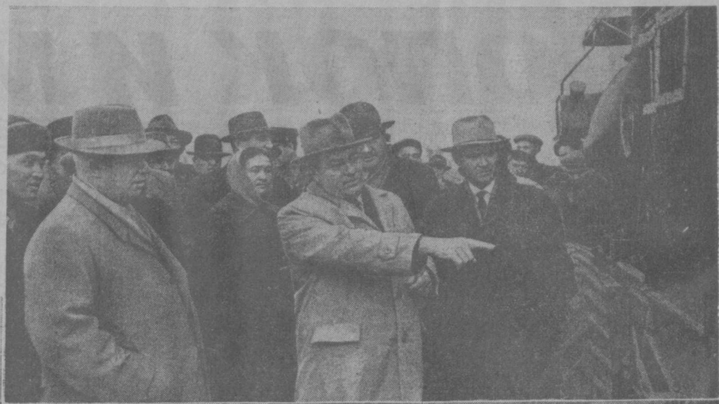
На снимках: встреча товарища Н. С. Хрущева на станции Джизак; товарищ Н. С. Хрушев осматривает сельскохозяйственную технику в голоднозастойском совхозе «Пахта-Арал»; товарищ Н. С. Хрушев в колхозе «Политотдел» Верхнеирчирского района.