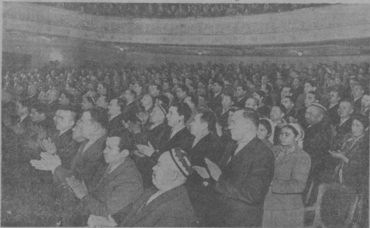
На заключительном заседании совещания работников сельского хозяйства республик Средней Азии, Азербайджана и южных областей Казахстана.