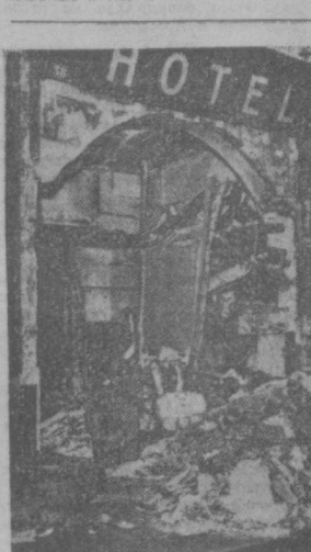
Французские газеты и агентства сообщают о многочисленных взрывах, устраиваемых «ультра» в Париже. На днях взорвалась бомба в общежитии студентов-мусульман, другая разрушила кафе, принадлежавшее алжирцу, третья была подожжена в гостинице, где останавливаются уроженцы Северной Африки. НА СНИМКЕ: разрушенный вход в гостиницу в Париже.

Лондон, 26 ноября. (ТАСС). Национальный конгресс мира Великобритании открылся сегодня в Лондоне. Конгресс призван способствовать урегулированию германского