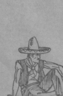
Шедрость грабителя. Рис. В. Жаринова.

...Шедрость грабителя. Рис. В. Жаринова.