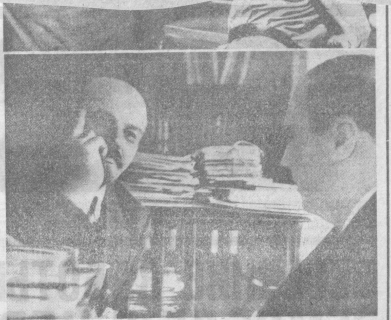
Рис. Д. СИНЦЕГО.