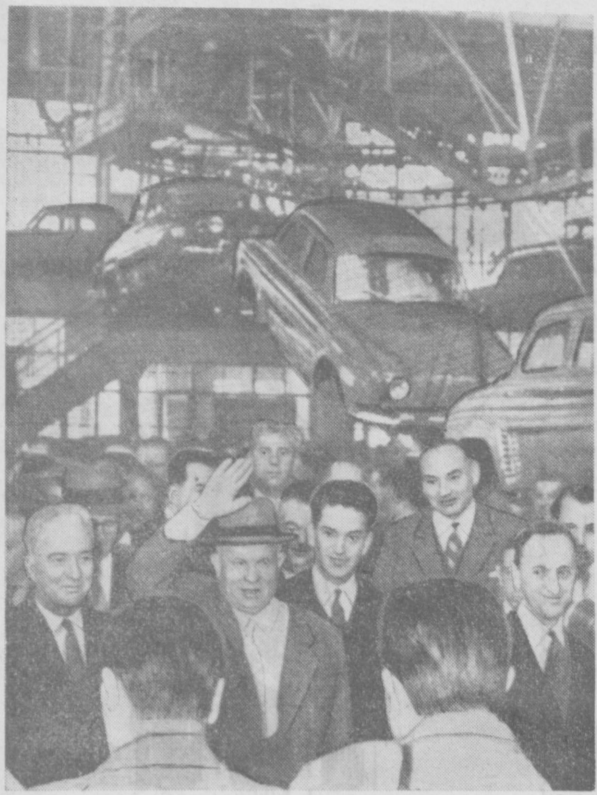
31 марта Председатель Совета Министров СССР Н. С. Хрущев побывал на автомобильном заводе фирмы Рено в городе Фленс. НА СНИМКЕ: Н. С. Хрущев в сборочном цехе завода.

Заявление Н. С. ХРУЩЕВА, переданное представителям профсоюзов Франции во время встречи в Париже 31 марта 1960 года