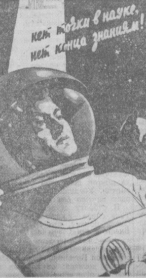
Агитплат, выпущенный Союзом художников Узбекистана в связи с десятидневным оборотом вокруг Земли третьего советского спутника. Художник А. Корюков.

При входе в плотные слои земной атмосферы они должны быть предохранены от сгорания и разрушения. Создание возвращаемых спутников необходимо для развития межпланетных сообщений. (ТАСС).