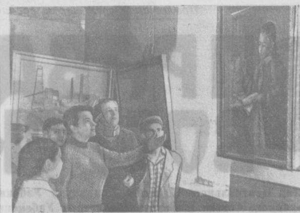
На передничной выставке работ художников Узбекистана в Термезе.

И мы спешим посмотреть, как чудесно работают эти люди, свыкшиеся с постоянными неудобствами быта, разрезаю-