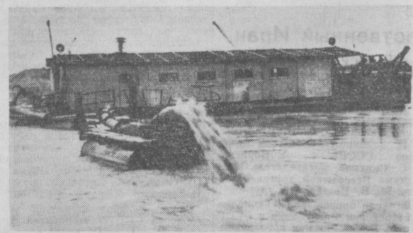
День и ночь из трубы земснаряда извергается пуля.

Л. ТОПОРКОВ. (Спец. корр. «Правды Востока».)