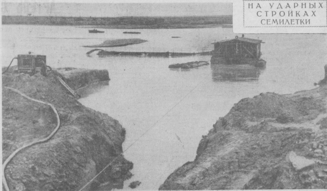
НА УДАРНЫХ СТРОЙКАХ СЕМИЛЕТКИ

В тот же день А. И. Микоян прибыл в Багдад. (ТАСС).