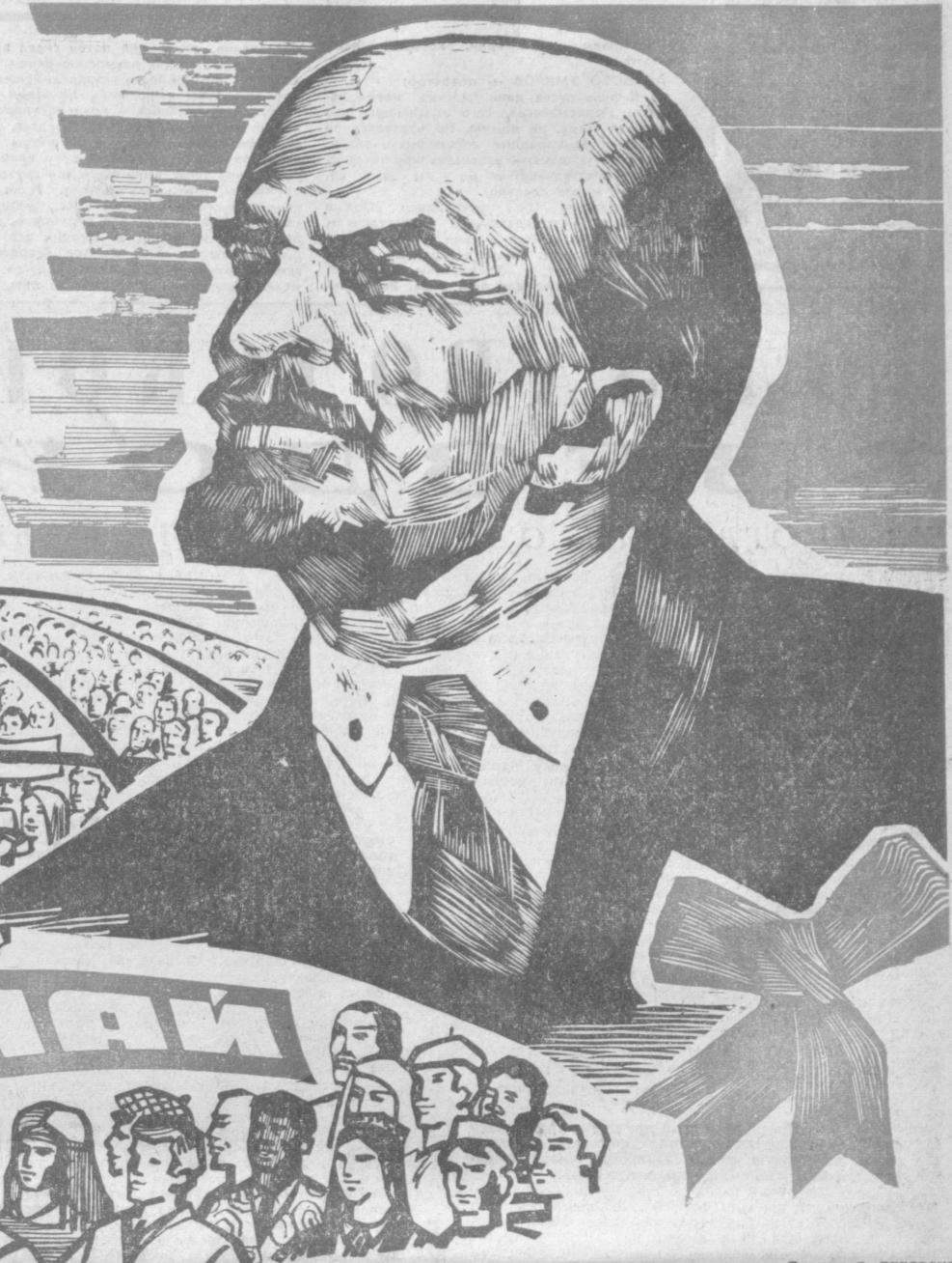
Рисунок Э. ЛЕЛЯВСКОГО