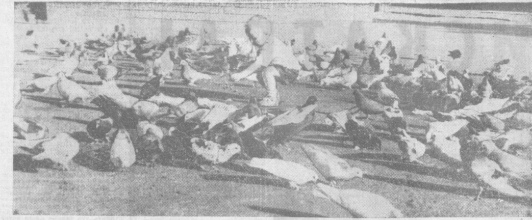
«Обед» на городской площади.

АНДИЖАНСКИЕ ПРЕМЬЕРЫ АНДИЖАН , 30 апреля. (По телефону от соб. корр.). На днях состоялся общегородской просмотр нового спектакля Андижанского областного театра кукол, а затем и премьеры — одобренная и похвалена жюри взрослых и детей пьеса «Зачем школяр болгарского драматурга М. Панчева. Песни и музыка и ней написаны танки и музыкальные позиторами. Национальный мотив и в оформлении спектакля посвящен болгаро-советской дружбе и 25-летию болгарской социалистической революции, которая будет отмечаться 9 сентября.