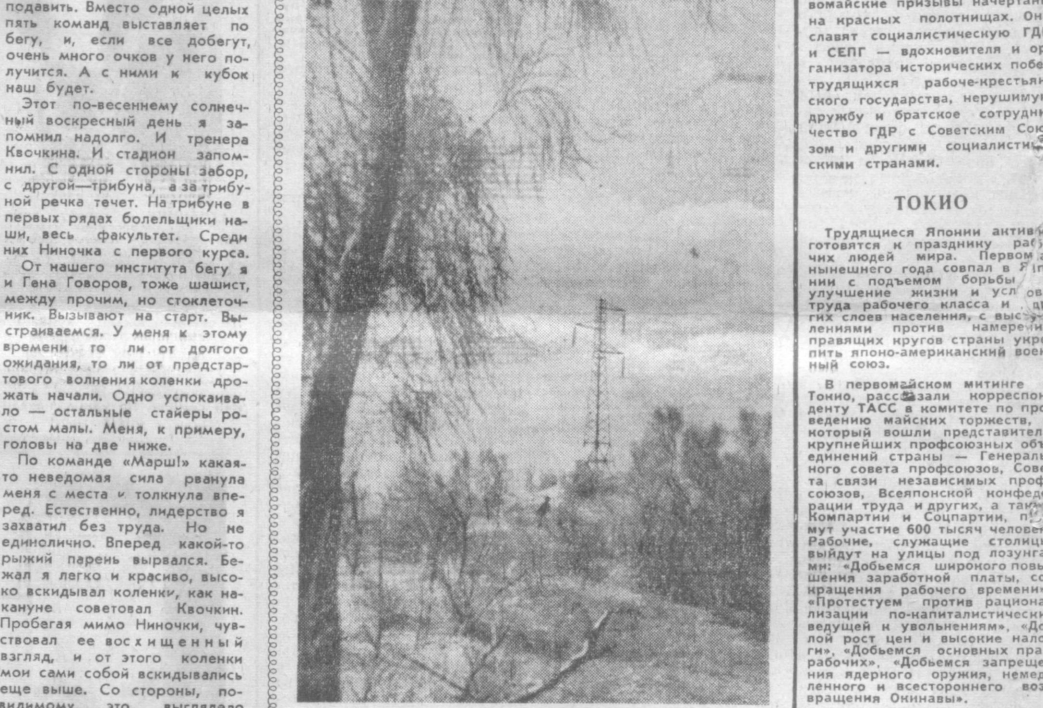
Современный пейзаж Кызылкумов.

последних сил. Ничего не вижу. И вдруг слышу привычный голос Квокина: «Пчелики, пора!». Несмотря на всю трагичность положения, смысл этого призыва до меня все же дошел. Квокин, видимо, решил, что я до этого момента прибегал силы, а теперь настало самое время обогнать рыжего. Это тренерское указание, как ни странно, увеличило мои жизненные ресурсы: я миновал трибуну и кое-как дотопился... до берега. Здесь, на берегу речки, мы и присидели весь вечер с Ниночкой с первого курса. Кстати, от нее я узнал, что рыжий, за которым я безуспешно гнался, был перовозарядником по бегу, участником многих соревнований. Ну и поспелился же мы! Вообще-то, это был один из самых чудесных вечеров в моей жизни. Вик. ЛЕВИН.