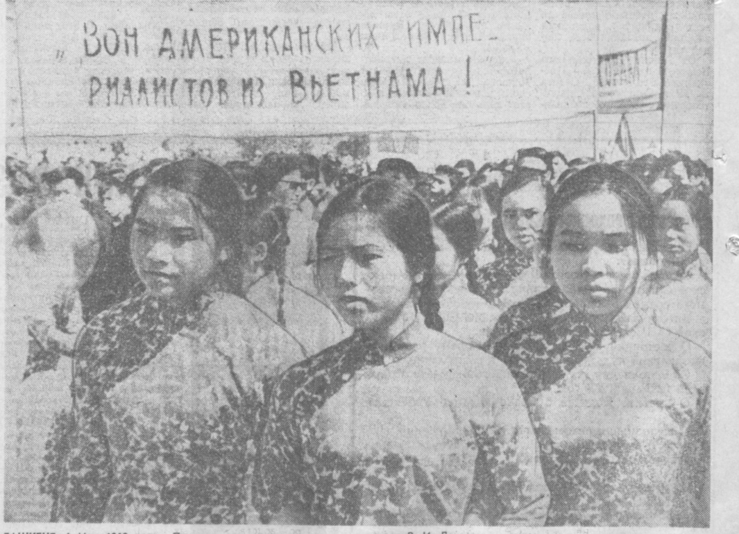
ТАШКЕНТ. 1 Мая 1969 года. Праздничная демонстрация на площади В. И. Ленина.