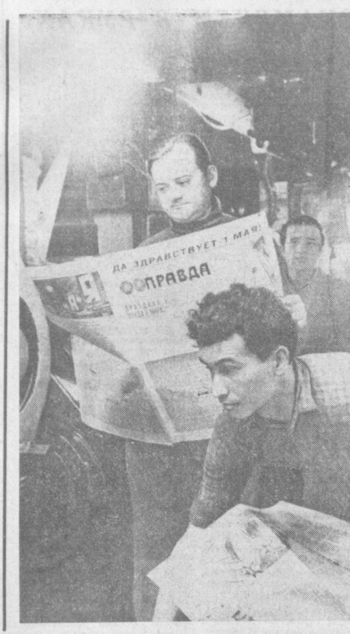
В типографии Объединенного издательства ЦК Компартии Узбекистана...