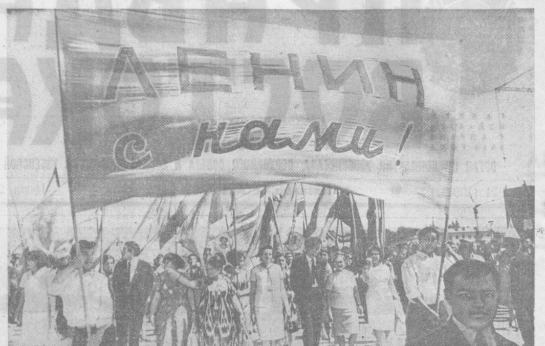
ТАШКЕНТ. 1 Мая 1969 года. Праздничная демонстрация на площади В. И. Ленина.

После митингов состоялась демонстрация трудящихся. (ТАСС).