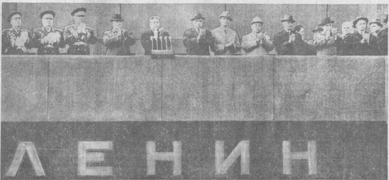
МОСКВА. КРАСНАЯ ПЛОЩАДЬ. 1 Мая 1969 года. На Центральной трибуне Мавзолея В. И. Ленина.