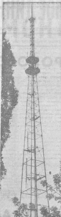
Антенна Ташкентского телецентра. Отсюда уходит в эфир передачи студии телевидения.