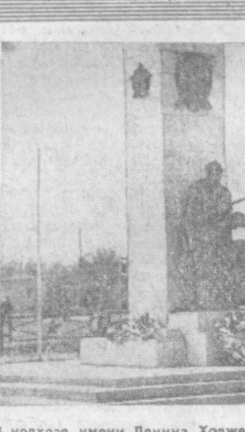
В колхозе имени Ленина Хорджейлинского района воздвигнут памятник воинам-землякам, погибшим в боях с немецко-фашистскими захватчиками.

«Эта книга о том, как мечты превратились в жизнь, книга-фотография о жизни одной из 15 братских республик...» Так написано на красочной суперобложке оригинального издания, выпущенного «Советским художником». «Живая сказка» — так назвал свою фотоповесть журналист Георгий Зельма, который более сорока лет с фотоаппаратом в руках, пешком и на верблюде, в автомобиле и на самолёте и снова пешком путешествовал по Узбекистану. В Узбекистане, работая в газетах, Г. Зельма и начал свой путь фотожурналиста.