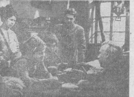
На снимках: кадры из фильмов «Орлята Чапая» и «Переходный возраст».