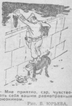
— Мне приятно, сэр, чувствовать себя вашим равноправным союзником. Рис. В. ЮРЬЕВА.

Правящая клика Тиланда, отработавшая долларные подлины, продолжает выискивать агресорам все больше плацдармов для нападения на соседние страны. (Из газет).