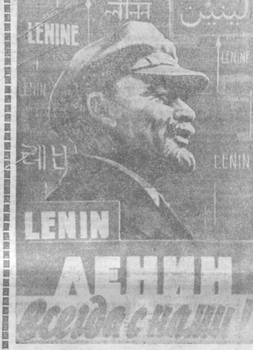
Плакат худ. М. КАЛНИНА.