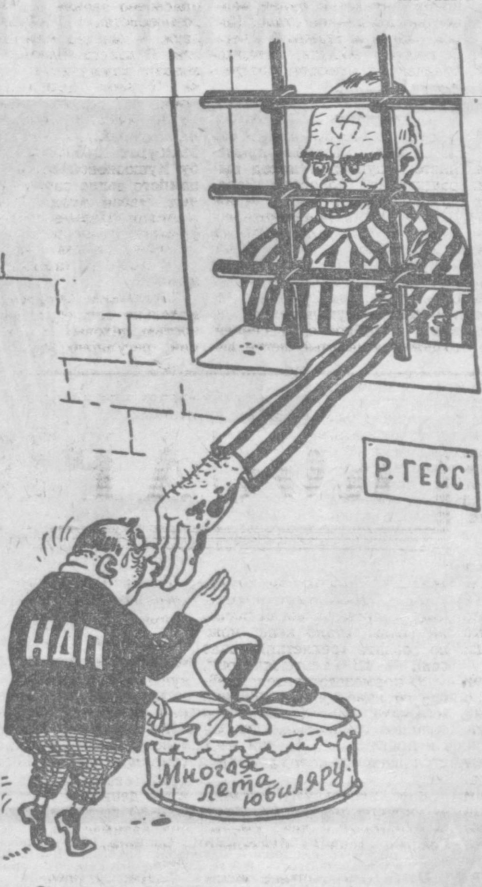
— Со знаменным юбилеем, шеф!