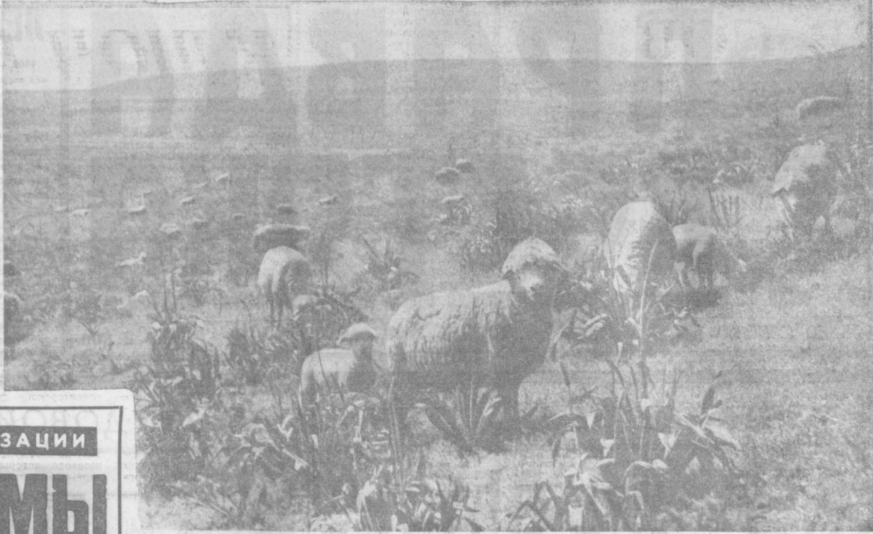
В Джизакской степи.

НАШЕ ОБЯЗАТЕЛЬСТВО произвести мяса—170 тысяч тонн, Н А 1969 Г О Д: молока—390 тысяч тонн, яиц—230 миллионов штук, шерсти—16.700 тонн; заготовить 3.000.000 тонн грубых кормов, заложить 3.000.000 тонн силоса.