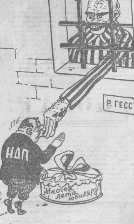
— Со славным юбилеем, шеф! Рис. Ю. ВРОДИЦКОГО.

Играя на националистических чувствах западногерманских обывателей, авторы «Обращения» требуют особых привилегий для ФРГ в решении основных международных проблем. С пространной речью на съезде выступил председатель правления НДП Адольф фон Таден. Фюрер неонацистов выразил удовлетворение отказом боннского правительства.