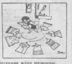
Весенние мундштук. Рис. С. МАМЕДЗАДЕ.