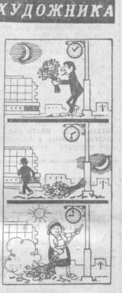
Без слов. Рис. Д. СИННИКОВО.