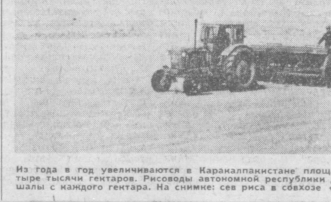
Из года в год увеличиваются в Каракалпакстане площади под посевы риса. В нынешнем сезоне они расширились на четыре тысячи гектаров. Рисоводы автономной республики дали слово собрать в четвертом году пятилетки по 35 центнеров шалы с каждого гектара. На снимке: сев риса в совхозе «Майба» Чимбайского района.

ТЕРМЕЗ, 19 мая. (По телефону от соб. корр.). Любо посмотреть на это хлебное поле: зеленым морем разлилась рослая пшеница, крупные колосья, кажется, на глазах набирают силу. Мы — в джаркурганском колхозе «Кызыл Октябрь», в зерноводческой бригаде Ш. Джурбаева. Осенью, начиная сев, хлеборобы обязались вырастить на круг 50 центнеров с гектара. Сегодня еще больше видна верность намеченной цели. Больших забот потребовало поле от земледельцев: трижды поливали хлеба, внесли минеральные удобрения, хорошо пробороздили посеи.