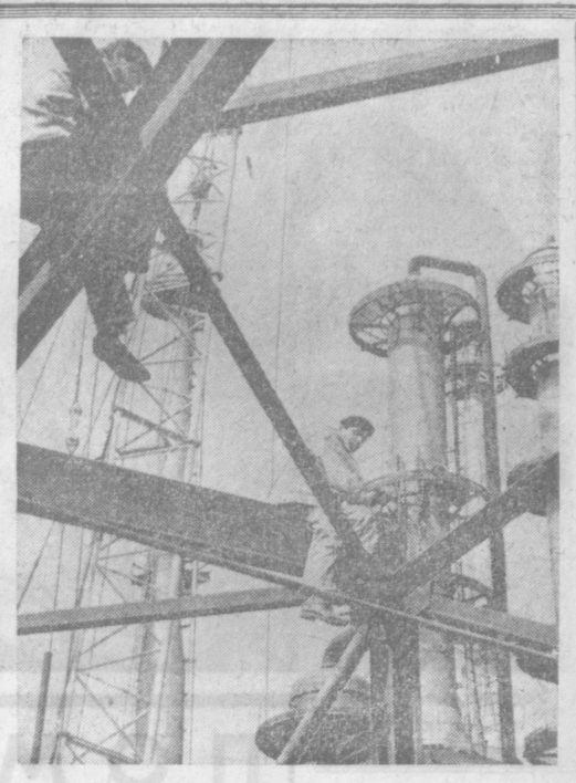
Быстрыми темпами идут строительные работы по возведению новых цехов производства органических веществ на Навоийском химинбинате. На снимке: монтаж оборудования одного из участков цеха ацетиленовый, который будет сдан под пуск-наладку в третьем квартале нынешнего года. Снимок нашего читателя Г. ИСТРЕБОВА.

ния машинно-тракторного парка в колхозе «Ленинград» Сырдарьинского района. В книге учета стали отражать все показатели формы 34 (первичного документа), а также стоимостные показатели по каждой машине. В любое время правление, председатель бригады и ры знают состояние дел и могут принять меры. Все затраты, связанные с использованием колхозной техники, учитывают не на многих счетах, а на одном. И сразу раскрывается вся картина. Хотелось, чтобы при обсуждении проекта Примерного Устава в колхозах республики земледельцы обратили внимание на эффективность комплексной механизации. Мы раскрыли только одну из причин плохого использования техники в ряде хозяйств и районов Сырдарьинской области. Обсуждение может привести к большому и полезному разговору о наиболее — как взять от колхозной техники максимум того, что она способна дать. Р. ГУБАЕВ, Главный экономист по координации деятельности опытно-показательных хозяйств Сырдарьинского областного управления сельского хозяйства.