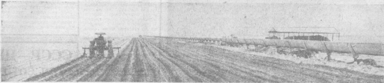
На необозримых плантациях первого отделения совхоза имени Ленина идет культивация хлопчатника.

из голодноступенского совхоза ИМЕНИ ЛЕНИНА