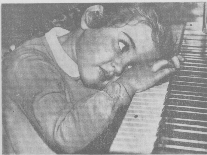
«УТОМИЛАСЬ». Фотохудож. М. Руденко. (Из снимков, присланных на фотоконкурс).