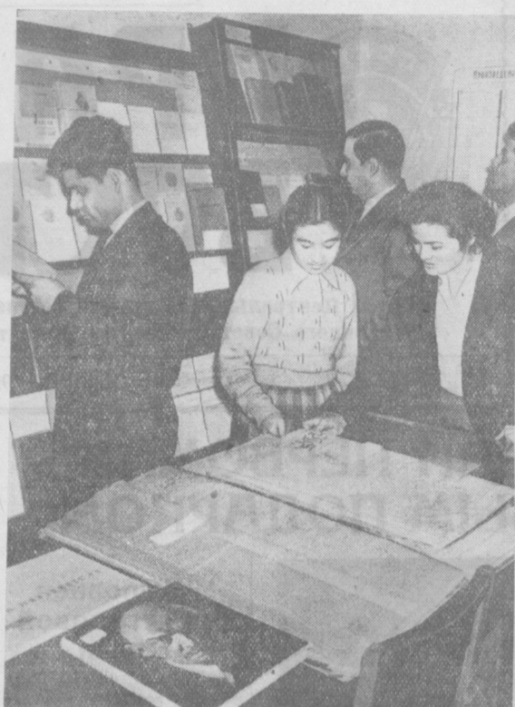
На выставке в Институте истории партии при ЦК КП Узбекистана. Среди экспонатов — первые издания ленинских произведений, материалы, рассказывающие о большом внимании, которое уделял В. И. Ленин народам Советского Востока.

Сессия приняла решение, в котором указывается, что местные Советы должны повысить свою роль в борьбе за выполнение социалистических обязательств по увеличению производства животноводческих продуктов.