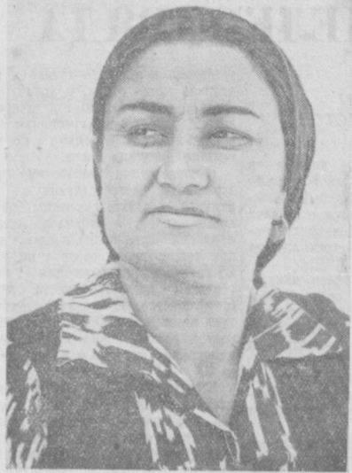
И вот Майхонча, надев белый халат, снова возле подонок а. Звенят струйки