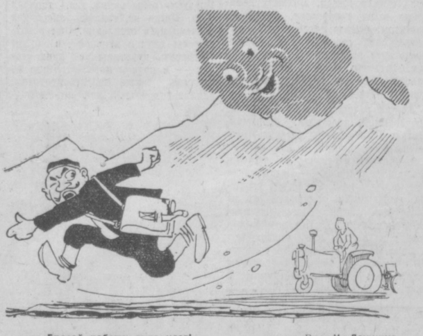
Бросай работу: туча идет! Рис. М. Леушина.

Началось движение по новому 3-километровому Чинчикускому железнодорожному двухколейному мосту через реку Уянху. Введение в эксплуатацию Чинчикуского железнодорожного моста улучшит сообщение между северной и южной частями Китая и будет содействовать росту промышленного и сельскохозяйственного производства.