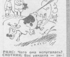
РАИС: Чего она испугалась? СКОТНИК: Вас увидела — зимовку вспомнила. Рис. Д. СИННИЦКОГО.