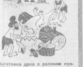
Заготовка дров в далеком прошлом.