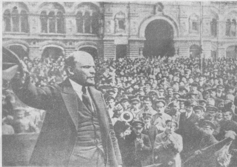
Москва. Красная площадь. 25 мая 1919 года. Владимир Ильич Ленин выступает на парадной части Всевобуча.