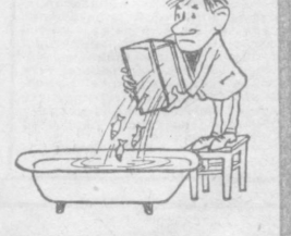
Когда запрещена рыбалка... Рис. А. ФОМИНА.