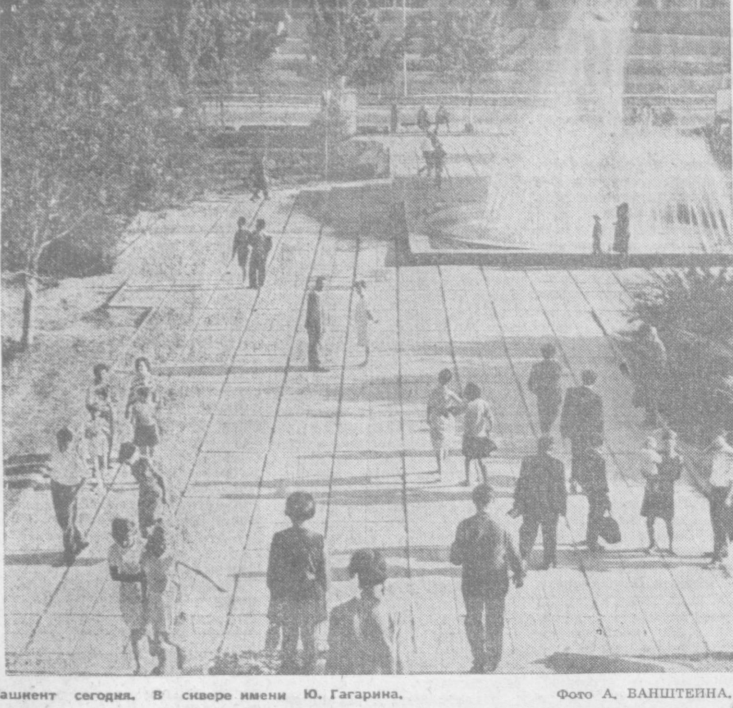
Ташкент сегодня. В сквере имени Ю. Гагарина.