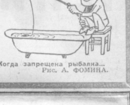
Когда запрещена рыбалка... Рис. А. ФОМИНА.