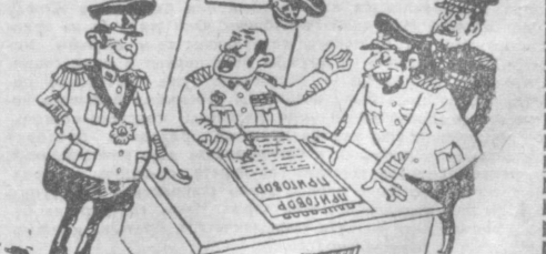
— А. может быть, господи, просто сразу отгородить большую решеткой все остальное население.

Усилия кровавые репрессии против греческого народа, «черные полновинки» брошены в тюрьмы сотня патриотов.