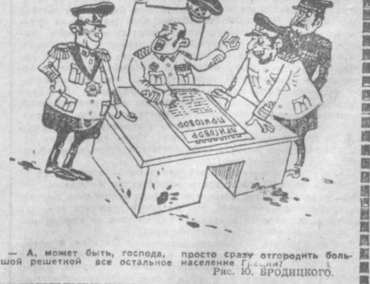
— А, может быть, господа, просто сразу отгородить большой решеткой все остальное население. Рис. Ю. ВРОДИЦКОГО.

Усиливая кровавые репрессии против греческого народа, «черные полковники» бросают в тюрьмы сотни патриотов.