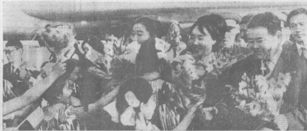
Встреча делегации монгольской молодежи в Ташкентском аэропорту.