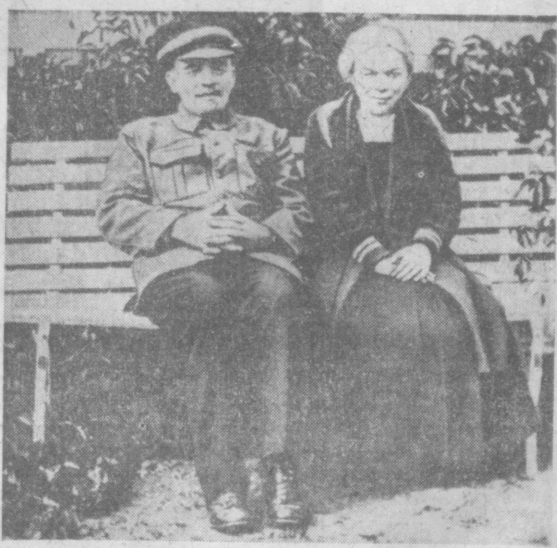
Владимир Ильич Ленин и Мария Ильинична Ульянова в Горках. 1922 г.

Письмо это Мария Ильинична Ульянова от имени В. И. Ленина вручила посланцам далекого Коканда в Кремле 20 октября 1923 года, приняла от них в дар резной восьмигранный столик и три таких же табурета. Столик очень понравился Ильичу, и он поставил его в своей комнате в Большом доме в Горках.