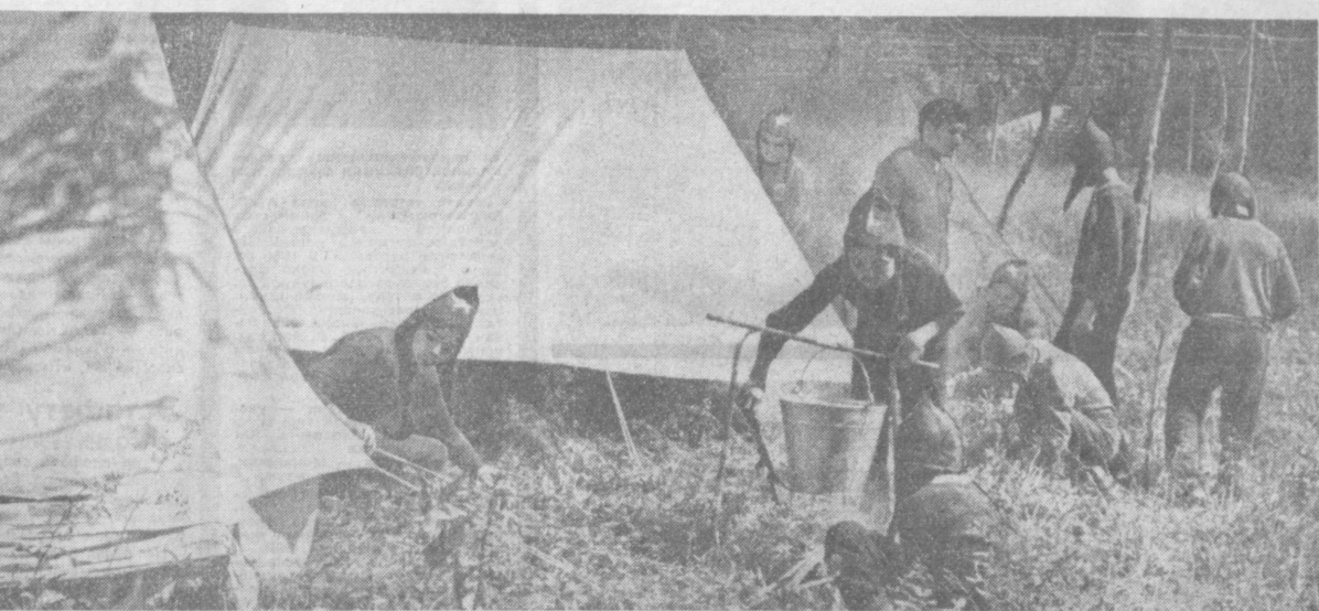
Полноценной, интересной жизнью живут дети Страны Советов. К их услугам прекрасные Дворцы пионеров, лагеря, здравницы. Особенно увлекаются ребята туристскими походами...