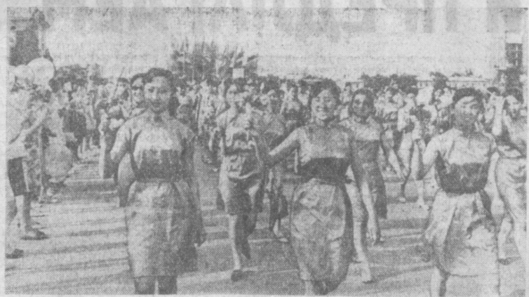
Торжественное шествие участников фестиваля. Идут монгольские девушки.