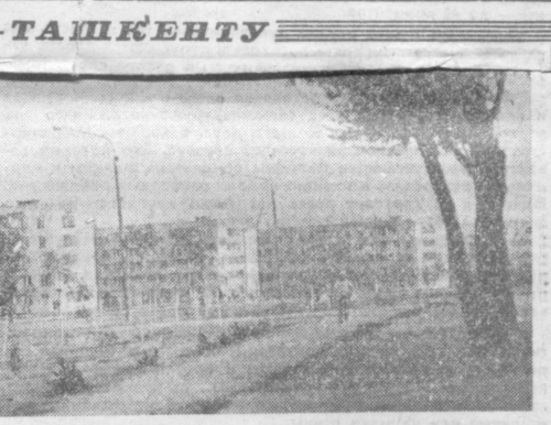
Эти новые дома на Чиланзаре — подарок строителей Ленинграда трудящимся Ташкента.