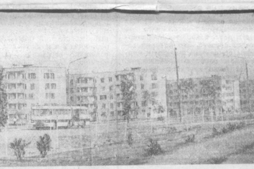
Эти новые дома на Чиланзаре — подарок строителей Ленинграда трудящимся Ташкента.