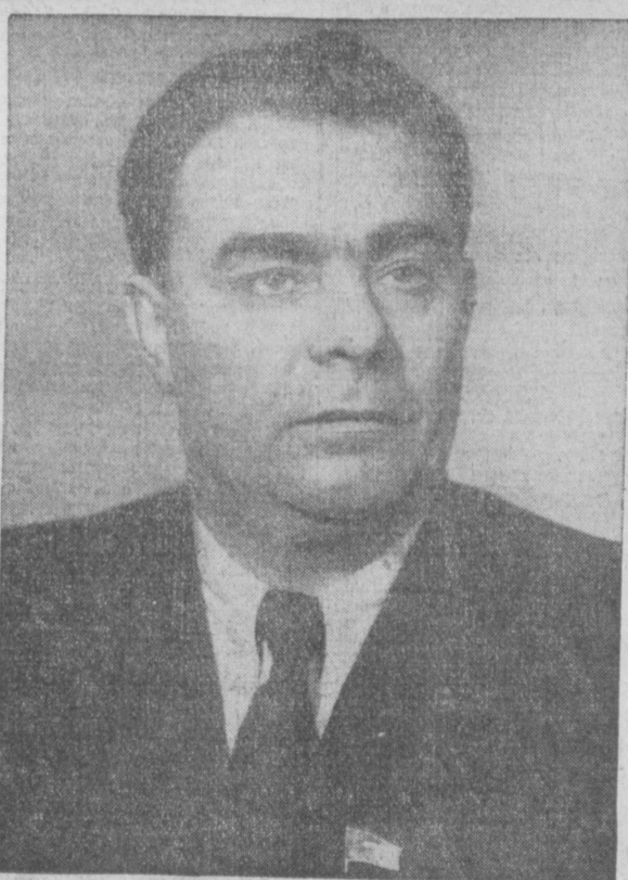
Председатель Президиума Верховного Совета СССР Леонид Ильич БРЕЖНЕВ.

Председателем Президиума Верховного Совета СССР избран Л. И. Брежнев.