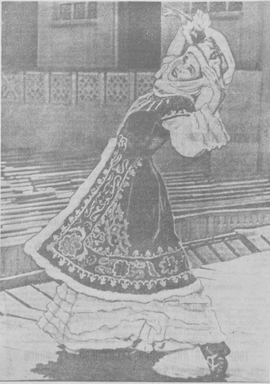
Киргизский народный танец в исполнении народной артистки СССР Бибисары Бейшеналиевой.

Страницы архивных документов свидетельствуют о совместном участии узбекских и киргизских деятелей в социалистической реконструкции сельского хозяйства. Узбекские хлопководы переда-