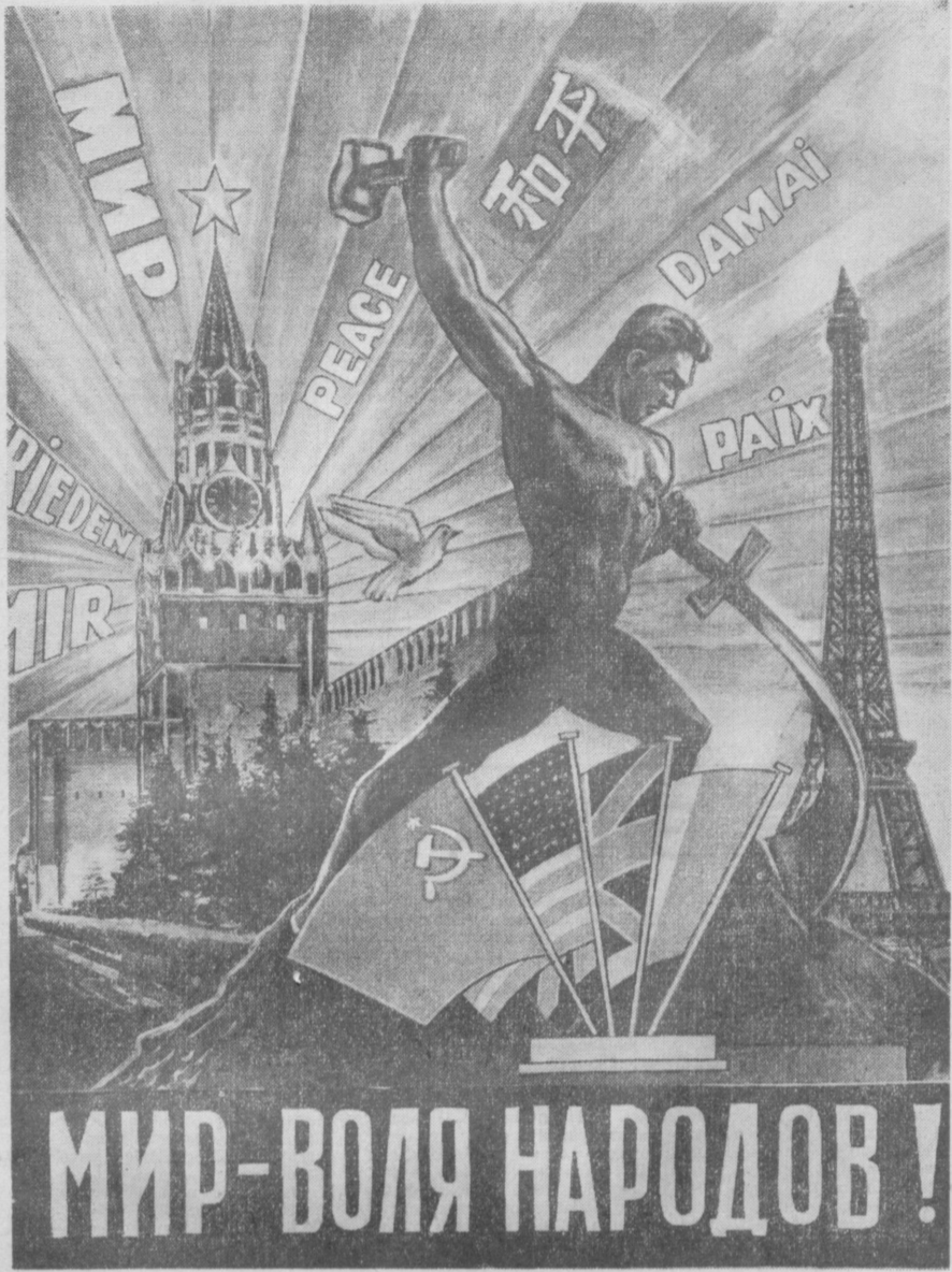
Фотомонтаж П. Шах-Назарова.