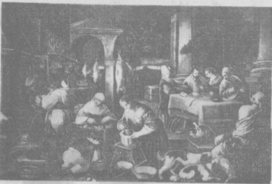
Школа Бассано, Притча о богаче и Лазаре. (Итальянская живопись XVI века).

△ Орган английских деловых кругов газета «Файнэншл таймс» отмечает в редакционной статье рост торговли между Англией и Советским Союзом. С января по апрель текущего года английский импорт из Советского Союза составил свыше 15 миллионов фунтов стерлингов, по сравнению с 12,7 млн. фунтов за этот же период прошлого года, а английский экспорт в Советский Союз более чем удвоился по сравнению с прошлым годом и составил 14 млн. фунтов стерлингов. △ По официальным данным наладского статистического бюро, в конце апреля в Нанане насчитывалось 517 тысяч безработных, что составляет 8,3 процента от всей рабочей силы. Как указывает печать, весна, которую правительство возлагало большие надежды, не принесла значительного сезонного уменьшения безработицы. △ Группа депутатов-коммунистов в составе 10 человек обратилась и альпийскому правительству с запросом, может ли оно дать заверения тем, что территория Италии не будет использоваться для совершения резистивных актов, подобных тому, который был совершен 1 мая в СССР. Депутаты требуют ликвидации ракетных баз, которые в силу своего характера могут лишь вызвать трагедию и неопытные бедствия в итальянских городах и населении страны. △ В ночь с 30 на 31 мая во Франции началась общенациональная часовая забастовка французских железнодорожников. Забастовка организована в знак протеста против отказа администрации догнать увеличить заработную плату железнодорожникам.