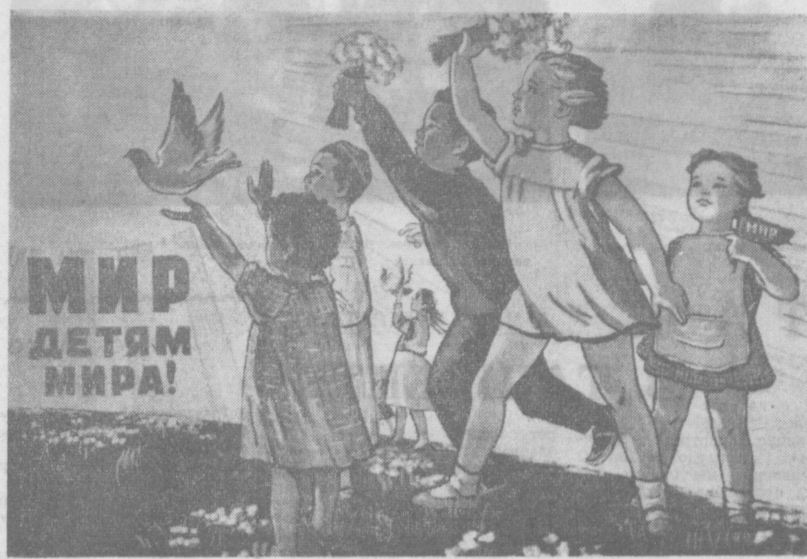
Плакат Г. Шубина. (Москва, Изолга)

СЕГОДНЯ — МЕЖДУНАРОДНЫЙ ДЕНЬ ЗАЩИТЫ ДЕТЕЙ