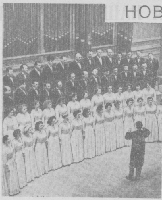
НА СНИМКЕ: выступает хоровая капелла «Дойна».

Совещание в верхах не состоялось потому, что в мирное небо СССР был заслан шпионский самолет «У-2», потому что нынешнее правительство Соединенных Штатов провозгласило позорную и скверную политику «У-2». Огромное большинство народа США много раз и многими путями заявляло о своем стремлении к мирному разрешению всех вопросов. Это стремление, я знаю, не изменилось; и я знаю, что желание исследовать лучшие пути к достижению мир-