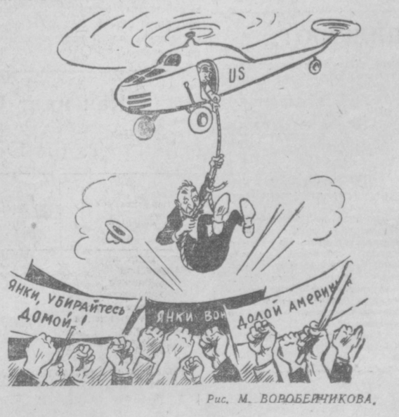
Янки, уберите домой!