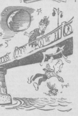
Ночью нас никто не встретит, мы простимся на мосту...