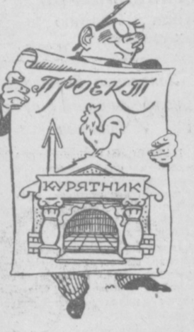
Архитектор Роскошкин создал шедевр... людям на смех.