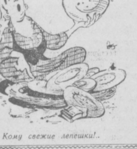
Кому свежие лепешки!