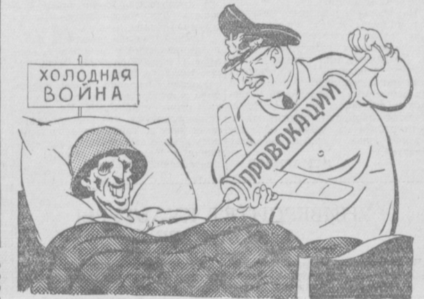
«Животворное» вливание или Пентагон-врачеватель. Рис. Д. Синицкого и Н. Леушина.

В течение неполных 130 лет, с 1776 по 1900 год, США увеличили свою территорию почти в десять раз. Это было результатом 114 войн, в которых, согласно официальным данным, имело место 8.600 сражений с участием американских войск и еще большого количества интервенций, спровоцированных в тех же целях.