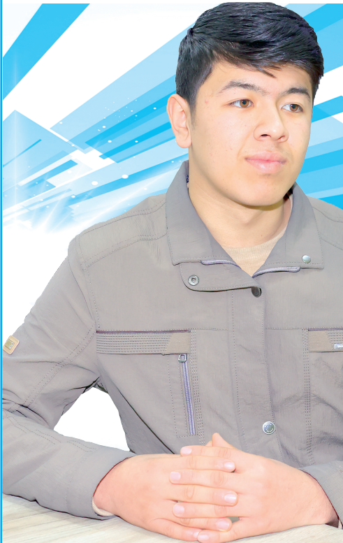
Бу, албатта, мамлакатимизда ёшлар учун яратилган қулайликлар самарасидир. Бугунги кунда Америкадаман,