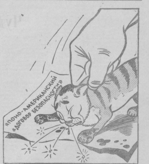
ЧТОБ ЧИСТ БЫЛ ДОМ...

Политские неукротимо стремление японского народа вырваться из оков американского империализма и положить конец опасному заговору поборников американско-японского военного союза.