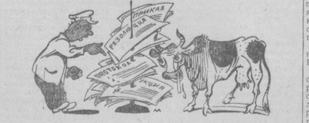
ОТ ТАКИХ КОРМОВ ВПОРУ И НОГИ ПРОТЯНУТЫ! Рис. С. Марфина.

Стадо крупного рогатого скота намечалось довести по району до 8.600 голов, в том числе коров до 2.800 голов. Прошло почти полгода, но план по общему поголовью выполнен лишь на 85 процентов, а по коровам — только на три четверти. Не повезло и овцам. Ожидаемых результатов. Вместо 11.500 овец в стадах сейчас насчитывается на полторы тысячи меньше. Что касается птицы, то, пожалуй, не насчитаеть и половины намеченного плана поголовья. Особенно тревожное положение с крупным рогатым скотом и птицей создается в колхозах «Коммунизм», имени XIX партсъезда, имени 40-летия Октября и имени Калининна. Здесь допущено снижение поголовья коров. Из-за бесконтрольности со стороны район-