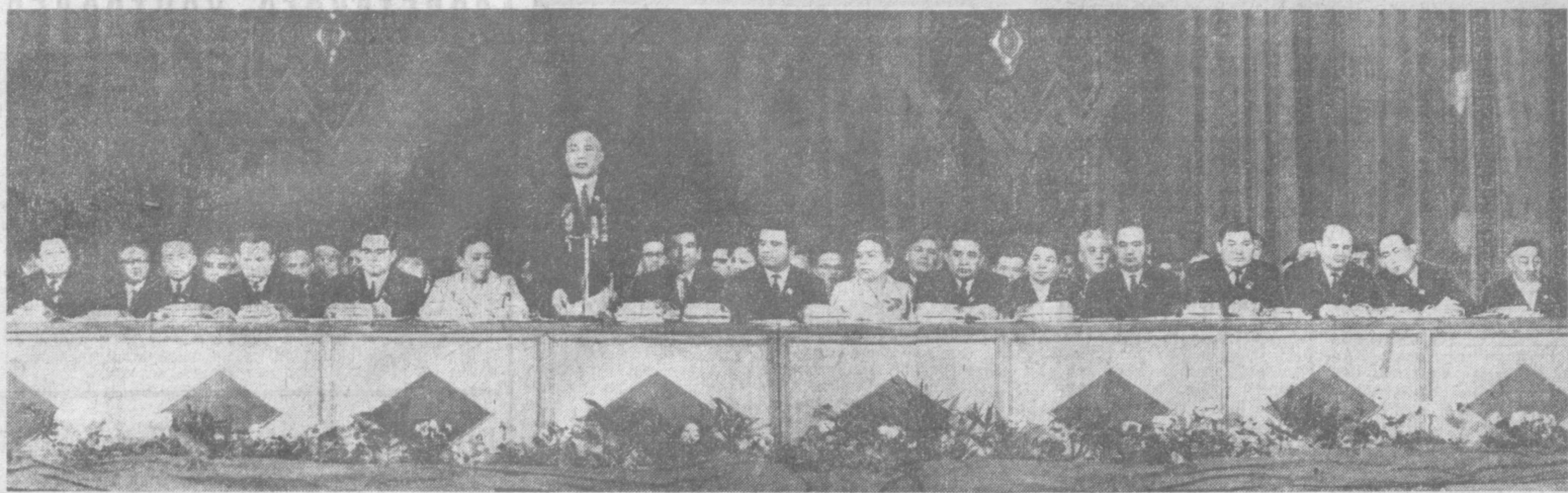
В президиуме собрания, посвященного открытию недели каракалпакской литературы и искусства в Ташкенте.