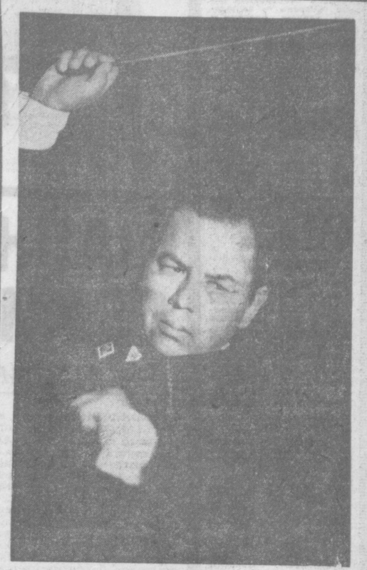
В дни недели каракалпакской литературы и искусства в Ташкенте зрители услышат хор в сопровождении симфонического оркестра, который исполнит песню «Менинг Узбекистаным». Музыку написал каракалпакский композитор, главный дирижер театра имени К. С. Станиславского Абдураим Султанов. Его вы и видите на этом снимке.