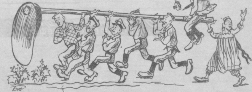
Рис. Б. ЖУКОВА.

В колхозе имени Кирова Ширабадского района на обработке посевов хлопчатника широко используется кетмень, в то время как пропашные тракторы простаивают. (Из письма в редакцию).