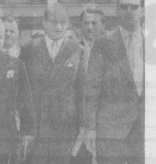
1. Н. С. Хрущев и сопровождающие его лица осматривают водолечебницу «Гершенбад». 2. Жители австрийской столицы Вены приветствуют Н. С. Хрущева. Фото специального фотокорреспондента ТАСС В. КОШЕВОВА. (Принято по фототелеграфу).

С докладом «Школа на современном этапе строительства коммунизма и задачи учителя» выступил министр просвещения РСФСР Е. И. Афанасенко. (ТАСС).