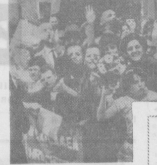
1. Н. С. Хрущев и сопровождающие его лица осматривают водолечебницу «Гершенбад». 2. Жители австрийской столицы Вены приветствуют Н. С. Хрущева. (Принято по фототелеграфу).

Вместо того чтобы сначала посеять позднеспелые родительские формы гибрида «ВНР-156», в совхозе в первую очередь заселили поля скороспелым гибридом сорта «ВНР-42». Сев производился в двойном расходе семян отцовской линии, и их не хватало. Кроме того, расчет потребности семян производился в зерне, а база ми-