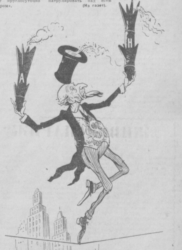
Опасный трюк империалистических акробатов.

Антиамериканские выступления по случаю дня независимости США имели место также в Сан-Хуане (Пуэрто-Рико). Во время торжества по случаю Дня независимости США пуэрториканцы, выступившие с лозунгами за независимость своей родины, превалили церемонию и заперли местный национальный гимн.