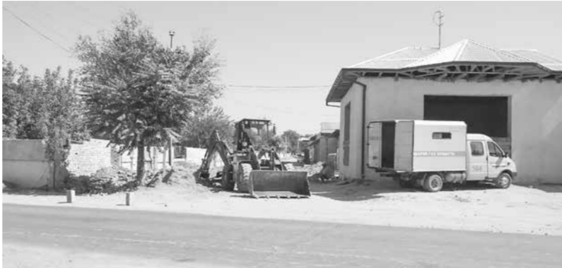
Шароф МАРУПОВ, маҳалла фаоли.

Юртимизда амалга оширилаётган ислохотлар замирида энг аввало, аҳолининг яшаш шароитини яхшилаш масаласи туради. Аммо барча ҳудудларни биратўла яхши шароит билан таъминлаш қийин масала. Биз яшайдиган Самарқанд шаҳридаги Чилқудук маҳалласи аҳолиси ҳам анча пайтдан буён хонадонларида табиий газни кўриш орузи билан яшагани рост.