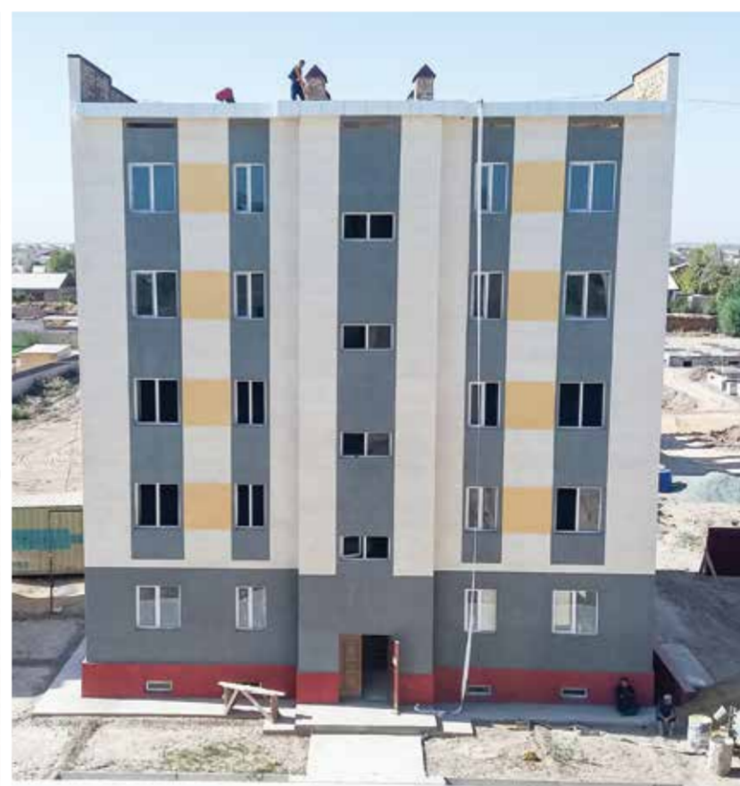
Янгиариқ туманидаги “Янги Ўзбекистон” массиви.