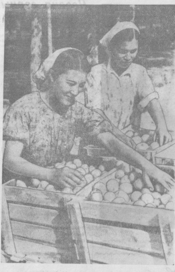
Колхоз «Камы Узбекистан» Орджоникидзевского района отпраздновал строительство Сибиря и Урала около 70 тонн ранних яблок «белый налив». На СНИМКЕ: колхозники Х. и Н. Юдашова за упаковкой яблок.

В. ПОПОНДОПУЛО. (Корр. «Правды Востока»).